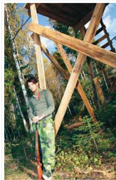
Älgtornet är perfekt och nu återstår bara en inskjutning av geväret.