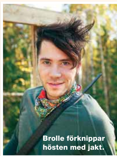
Brolle förknippar hösten med jakt.